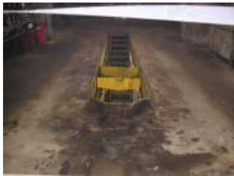
Figura N° 1.- Estado inicial Nave de Mantenimiento de Palas.

Estado inicial de la superficie contaminada; La nave de mantenimiento palas, presentaba un alto nivel de contaminación en sus pisos y paredes, derivado del trabajo propio de este tipo de talleres, lo que además de la mala presentación generaba problemas ambientales, sanitarios y de seguridad industrial para los trabajadores. Se pueden ver detalles del estado inicial en la figura N°1.