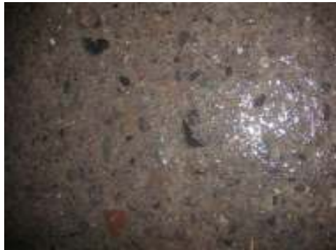
Figura N° 3.- Estado del piso después de la limpieza física y biológica, nótese el nivel de limpieza logrado.