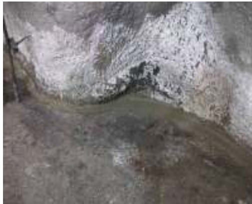
Figura N° 4.- Reparación de imperfecciones

Reparación de la superficie: según la magnitud del daño, se reparó la superficie dañada utilizando morteros de resina o cemento, se acondicionaron las juntas de dilatación de la superficie y cualquier otro daño identificado tras la limpieza con Masilla Plastikote 8500.