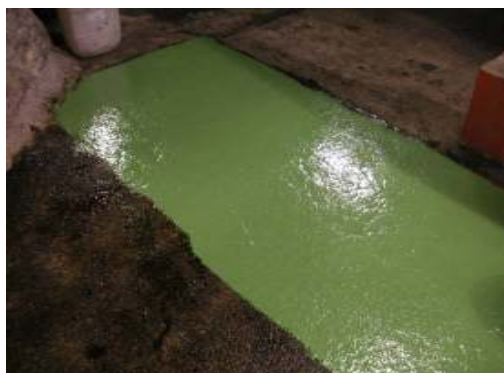
Figura N° 6.- Aplicación del producto Seirepox Multicapa 280.

Finalmente, se aplicó mediante brocha de pelo recortado o rodillo, la resina Seirepox Multicapa 280 , sin diluir, en una razón de 1.0 kg/m 2 . Este producto se aplicó en diversos colores, con el fin de habilitar las demarcaciones de seguridad necesarias para la operación interior mina.