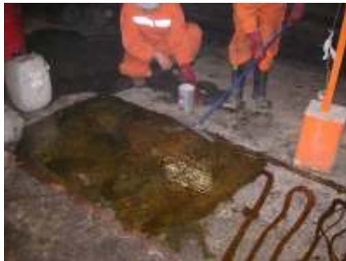
Figura N° 5.- Aplicación del producto Revepox 24 y posterior sembrado del filler.