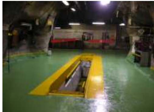
Figura N° 7.- Resultado final.