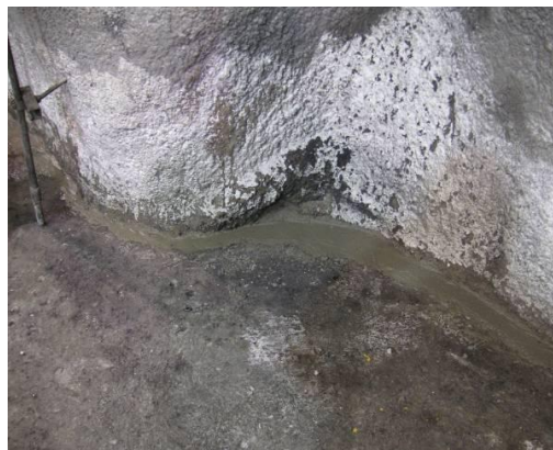
Figura N° 4.- Reparación de imperfecciones

Reparación de la superficie: según la magnitud del daño, se reparó la superficie dañada utilizando morteros de resina o cemento, se acondicionaron las juntas de dilatación de la superficie y cualquier otro daño identificado tras la limpieza con Masilla Plastikote 8500.