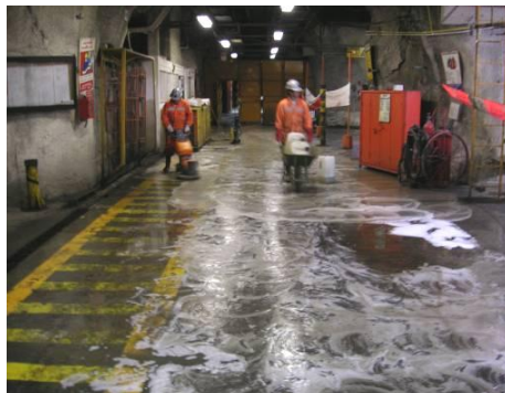
Figura N° 2.- Proceso de fregado del piso.

La secuencia de tratamiento comienza con una limpieza mecánica de la superficie con maquinaria especialmente diseñada para ese fin, de manera retirar la capa superficial de hidrocarburos y dejar el piso en condiciones óptimas para el siguiente paso que consiste en aplicar un sistema biológico en base a enzimas y bacterias que ataca el contaminante, transformándolo en productos inocuos para los trabajadores y el medioambiente. Los detergentes biológicos fueron incorporados a la superficie mediante el uso de vacuolavadoras o fregadoras de pisos, con el fin de que alcancen niveles más profundos de acción, dejando actuar el producto.