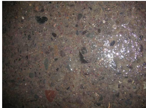
Figura N° 3.- Estado del piso después de la limpieza física y biológica, nótese el nivel de limpieza logrado.