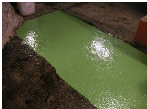
Figura N° 6.- Aplicación del producto Seirepox Multicapa 280.

Finalmente, se aplicó mediante brocha de pelo recortado o rodillo, la resina Seirepox Multicapa 280 , sin diluir, en una razón de 1.0 kg/m 2 . Este producto se aplicó en diversos colores, con el fin de habilitar las demarcaciones de seguridad necesarias para la operación interior mina.