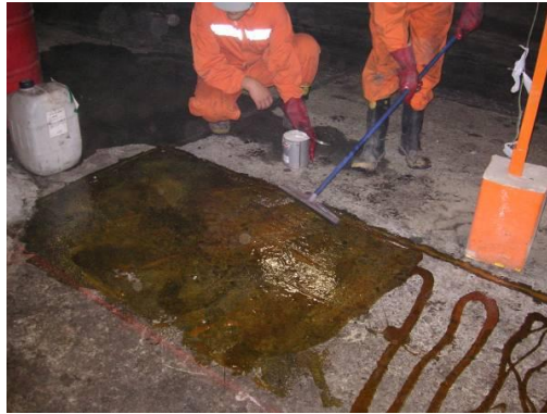
Figura N° 5.- Aplicación del producto Revepox 24 y posterior sembrado del filler.