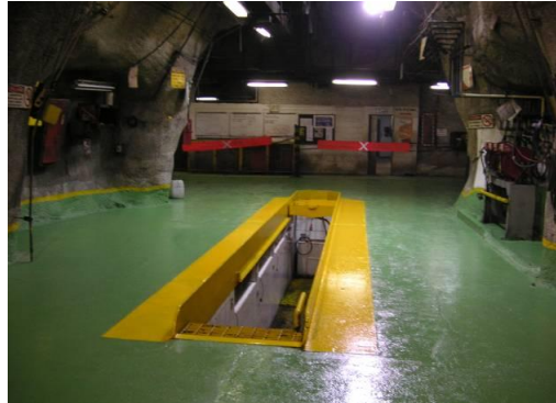
Figura N° 7.- Resultado final.