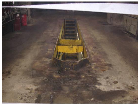
Figura N° 1.- Estado inicial Nave de Mantenimiento de Palas.

Estado inicial de la superficie contaminada; La nave de mantenimiento palas, presentaba un alto nivel de contaminación en sus pisos y paredes, derivado del trabajo propio de este tipo de talleres, lo que además de la mala presentación generaba problemas ambientales, sanitarios y de seguridad industrial para los trabajadores. Se pueden ver detalles del estado inicial en la figura N°1.